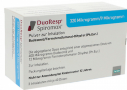
PZN: 11174720 Duoresp Spiromax 320µg/9µg/Dosis 3x60 ED Inhalationspulver