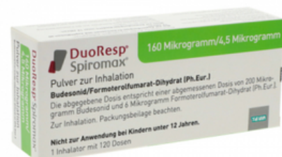
PZN: 11174654 Duoresp Spiromax 160 \mu\text{g}/4,5\mu\text{g}/\text{Dosis} 1 x 120 ED Inhalationspulver