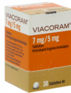
PZN: 17627513 Viacoram 7mg/5mg 30 Tabletten