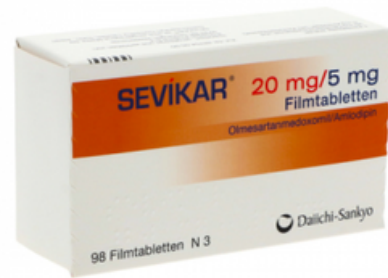
PZN: 11322959 Sevikar 20mg/5mg 98 Filmtabletten