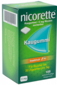
PZN: 07274663 Nicorette Freshfruit 2 mg 105 Kaugummi