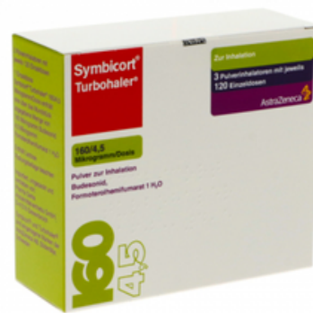
PZN: 03652312 Symbicort Turbohaler 160/4.5 mcg 120x3 Dosis