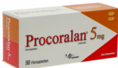
PZN: 10554515 Procoralan 5mg Filmtabletten