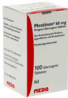
PZN: 10058650 Mestion 60 mg 100 überzogene Tabletten