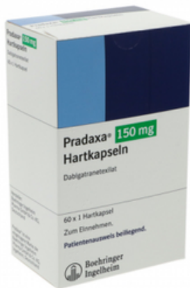
PZN: 17505299 Pradaxa 150 mg 60 Hartkapseln