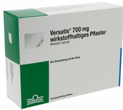
PZN: 15631597 Versatis 700mg 30 wirkstoffhaltige Pflaster