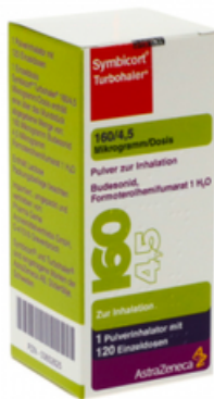
PZN: 03652625 Symbicort Turbohaler 160/4.5 mcg 120x1 Dosis