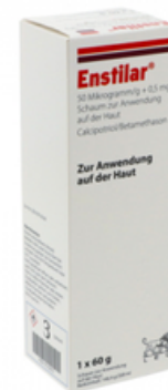
PZN: 17312672 Enstilar 50 Mikrogramm/g + 0,5mg/g Schaum 1x60 g