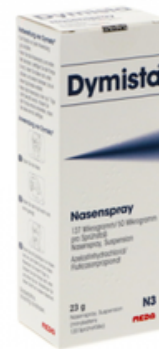
PZN: 18004286 Dymista Nasenspray 137 mcg/50 mcg/Sprühstoß