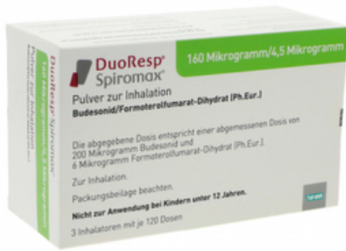
PZN: 11174683 Duoresp Spiromax 160µg/4,5µg/Dosis 3x120 ED Inhalationspulver