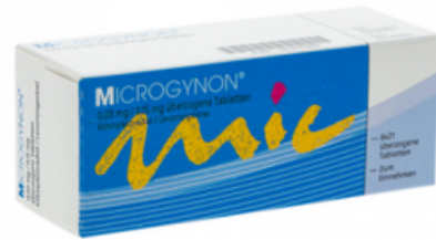
PZN: 04447092 Microgynon 0,03 mg/0,15 mg 6x21 überzogene Tabletten