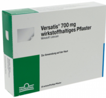
PZN: 15631580 Versatis 700mg 20 wirkstoffhaltiges Pflaster