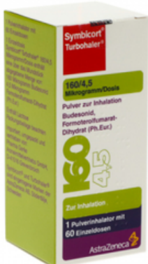
PZN: 03652890 Symbicort Turbohaler 160/4.5 mcg 60x1 Dosis