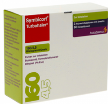
PZN: 03652878 Symbicort Turbohaler 160/4.5 mcg 60x3 Dosis