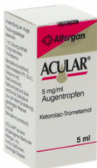
PZN: 01456191 Acular 5 mg/ml Augentropfen 5 ml