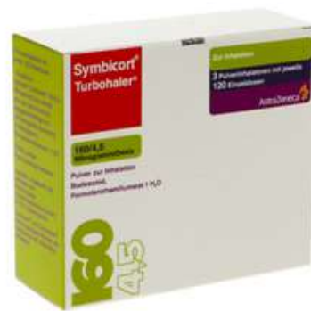
PZN: 03652312 Symbicort Turbhaler 160/4.5 mcg 120x3 Dosis