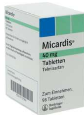
PZN: 07137908 Micardis 40mg 98 Tabletten