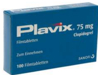
PZN: 04412544 Plavix 75 mg 100 Filmtabletten