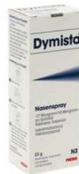
PZN: 18004286 Dymista Nasenspray 137 mcg/50 mcg/Sprühstoß