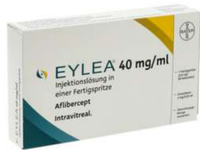
PZN: 17438887 Eylea 40mg/ml Injektionslösung i.e.Fertigspritze x 1*