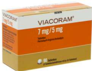
PZN: 17627536 Viacoram 7mg/5mg 90 Tabletten