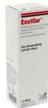
PZN: 17312672 Enstilar 50 Mikrogramm/g + 0,5mg/g Schaum 1x60 g