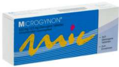
PZN: 04447086 Microgynon 0,03 mg/0,15 mg 3x21 überzogene Tabletten