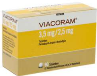
PZN: 17627507 Viacoram 3.5mg/2.5mg 90 Tabletten