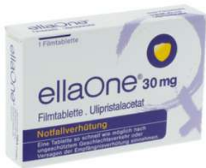
PZN: 15570571 Ellaone 30 mg Filmtablette