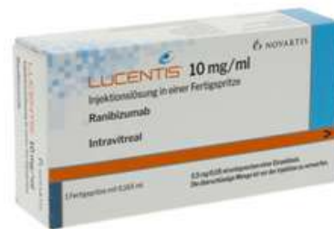
PZN: 12802897 Lucentis 10mg/ml 1 Injektionslösung*