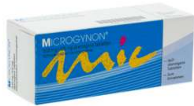
PZN: 04447092 Microgynon 0,03 mg/0,15 mg 6x21 überzogene Tabletten