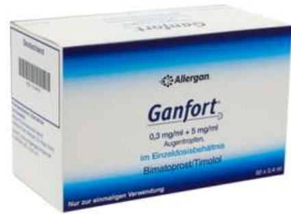
PZN: 13164743 Ganfort 0.3 mg/ml+5mg/ml 90x0.4ml Augentropfen