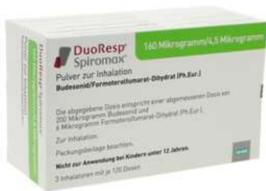
PZN: 11174683 Duoresp Spiromax 160µg/4,5µg/Dosis 3x120 ED Inhalationspulver