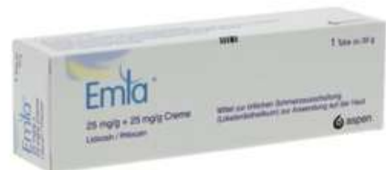
PZN: 13983004 Emla Creme 30 g