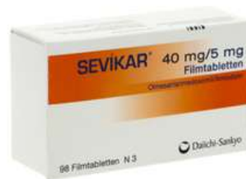
PZN: 09338930 Sevikar 40mg/5mg 98 Filmtabletten