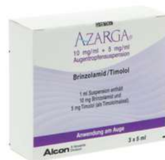
PZN: 11079246 Azarga 10 mg/ml + 5 mg/ml Augentropfensuspension 3x5 ml