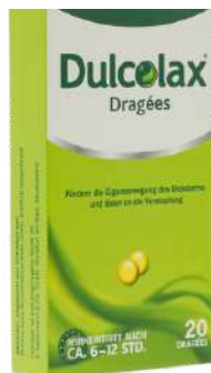
PZN: 07261123 DULCOLAX 5 mg magensaftresistente 20 Tabletten