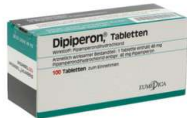
PZN: 13248121 Dipiperon 100 Tabletten