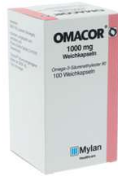
PZN: 09714942 Omacor 1000 mg 100 Weichkapseln