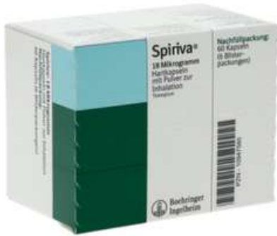
PZN: 10947580 Spiriva 18 mcg 60 Hartkapseln