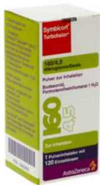
PZN: 03652625 Symbicort Turbhaler 160/4.5 mcg 120x1 Dosis