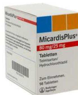
PZN: 00539779 Micardis plus 80 mg/25 mg 98 Tabletten