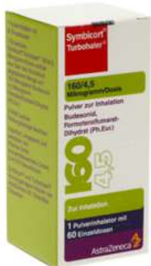
PZN: 03652890 Symbicort Turbhaler 160/4.5 mcg 60x1 Dosis