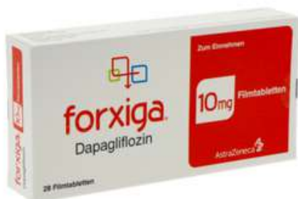
PZN: 18053540 Forxiga 10 mg 28 Filmtabletten