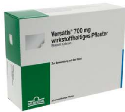
PZN: 15631597 Versatis 700mg 30 wirkstoffhaltige Pflaster