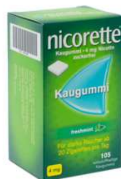
PZN: 10041968 Nicorette Freshmint 4 mg 105 Kaugummi