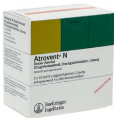
PZN: 11512921 Atrovent N Dosier-Aerosol 3x10 ml