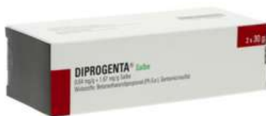
PZN: 03065589 Diprogenta Salbe 2x30 g