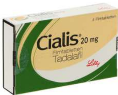
PZN: 00043423 Cialis 20 mg 4 Filmtabletten