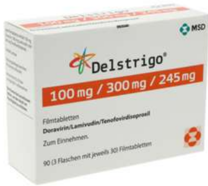
PZN: 18066206 Delstrigo 100 mg/300 mg/245 mg 3x30 Filmtabletten