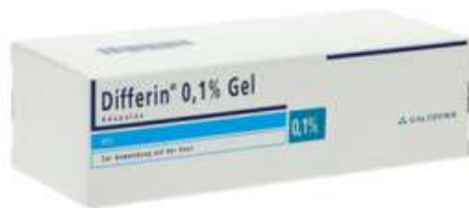
PZN: 17526769 Differin 0.1% Gel 2x30g