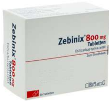
PZN: 10299589 Zebinix 800mg 90 Tabletten