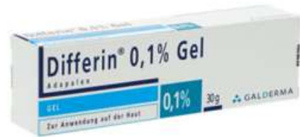
PZN: 17526752 Differin 0.1% Gel 1x30g