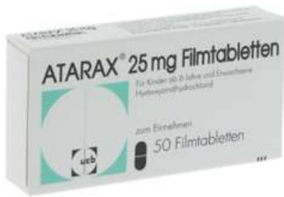
PZN: 01409004 Atarax 25 mg 50 Filmtabletten