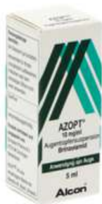
PZN: 11079246 Azopt 10 mg / ml Augentropfen 1x5 ml