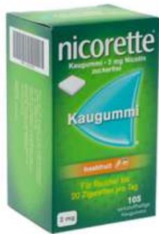
PZN: 07274663 Nicorette Freshfruit 2 mg 105 Kaugummi