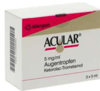
PZN: 01456593 Acular 5 mg/ml Augentropfen 3x5 ml