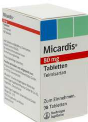
PZN: 07137860 Micardis 80mg 98 Tabletten