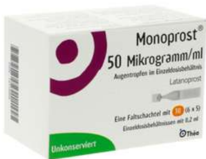
PZN: 14318668 Monoprost 50 mcg/ml Augentropfen ED 30x0,2 ml