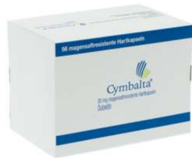
PZN: 01138829 Cymbalta 30 mg 98 Hartkapseln