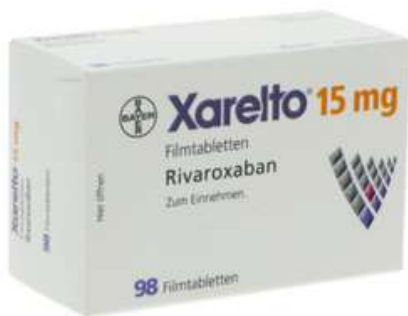
PZN: 10012168 Xarelto 15mg 98 Filmtabletten