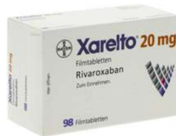
PZN: 10012197 Xarelto 20mg 98 Filmtabletten