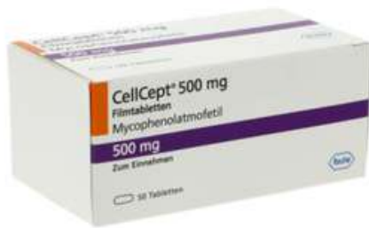
PZN: 10792901 CellCept 500 mg 50 Filmtabletten