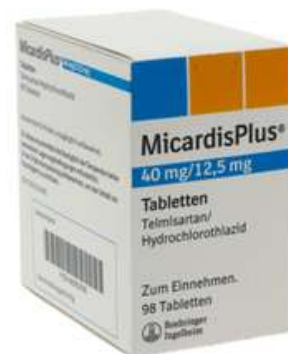
PZN: 06063390 Micardis plus 40 mg/12.5 mg 98 Tabletten