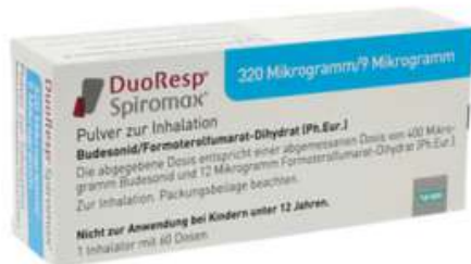
PZN: 11174708 Duoresp Spiromax 320µg/9µg/Dosis 60 ED Inhalationspulver