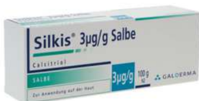
PZN: 06617078 Silkis 3 mcg/g Salbe 100 g