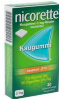
PZN: 07273959 Nicorette Freshfruit 2 mg 30 Kaugummi