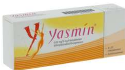
PZN: 08880070 Yasmin 0,03mg/3mg 3x21 Filmtabletten