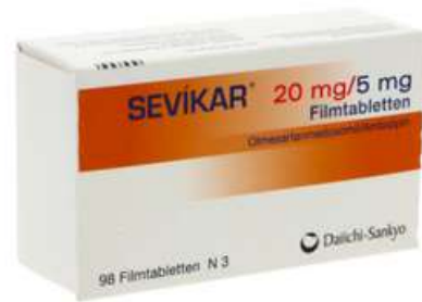
PZN: 11322959 Sevikar 20mg/5mg 98 Filmtabletten