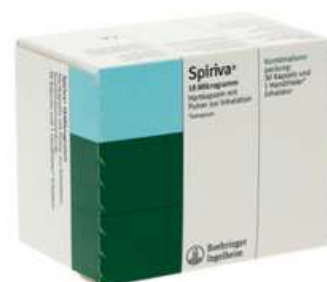
PZN: 10947568 Spiriva 18 mcg 30 Hartkapseln + 1 Handihaler