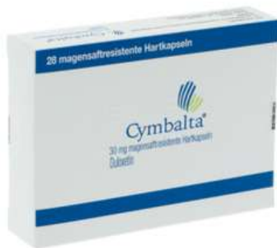
PZN: 07023990 Cymbalta 30 mg 28 Hartkapseln