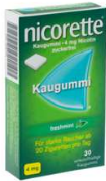
PZN: 10041945 Nicorette Freshmint 4 mg 30 Kaugummi