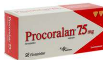
PZN: 10554538 Procoralan 7,5mg 98 Filmtabletten