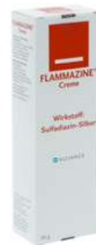
PZN: 10206085 Flammazine Creme 50g