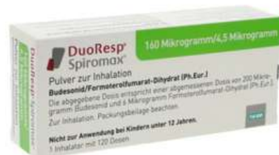
PZN: 11174654 Duoresp Spiromax 160 µg/4,5µg/Dosis 1 x 120 ED Inhalationspulver