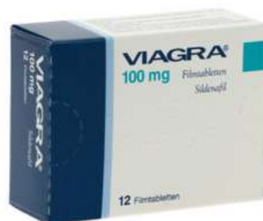
PZN: 04169931 Viagra 100 mg 12 Filmtabletten