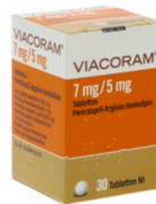
PZN: 17627513 Viacoram 7mg/5mg 30 Tabletten