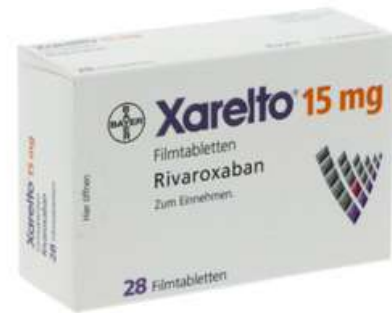
PZN: 10012145 Xarelto 15mg 28 Filmtabletten