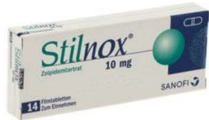
PZN: 18451654 Stilnox 10 mg 14 Filmtabletten