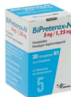
PZN: 06347957 BiPreterax 5 mg/1.25 mg 30 Filmtabletten