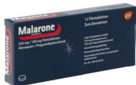
PZN: 10707367 Malarone 250mg/100mg 12 Filmtabletten