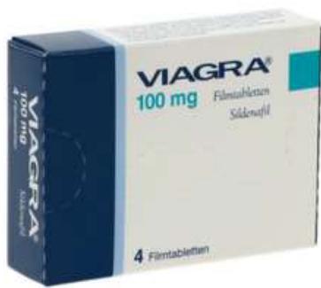
PZN: 05556110 Viagra 100 mg 4 Filmtabletten