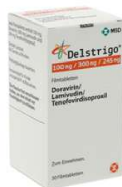
PZN: 18066198 Delstrigo 100 mg/300 mg/245 mg 1x30 Filmtabletten