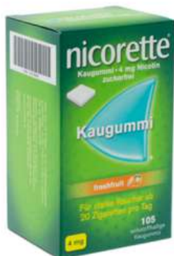
PZN: 07274835 Nicorette Freshfruit 4 mg 105 Kaugummi