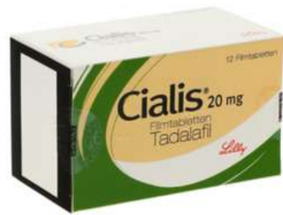
PZN: 00043417 Cialis 20 mg 12 Filmtabletten