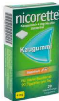
PZN: 07274829 Nicorette Freshfruit 4 mg 30 Kaugummi