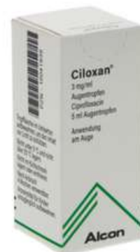
PZN: 10041939 Ciloxan Augentropfen 5 ml