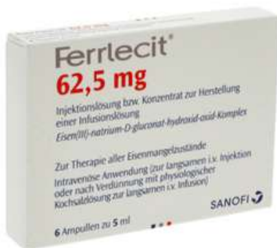
PZN: 10012122 Ferrlecit 62,5mg Ampullen 5ml