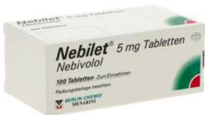
PZN: 13595816 Nebilet 5mg 100 Tabletten