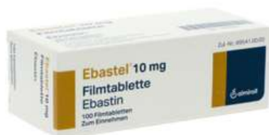
PZN: 15255645 Ebastel 10 mg 100 Filmtabletten