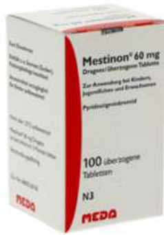
PZN: 10058650 Mestion 60 mg 100 überzogene Tabletten