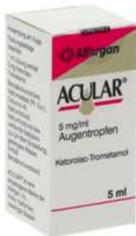
PZN: 01456191 Acular 5 mg/ml Augentropfen 5 ml