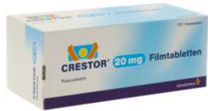
PZN: 06429129 Crestor 20mg 100 Filmtabletten