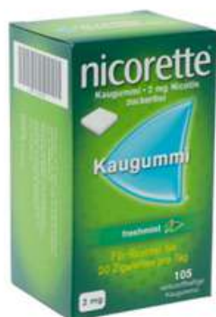
PZN: 07274812 Nicorette Freshmint 2 mg 105 Kaugummi