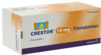
PZN: 06429081 Crestor 10mg 100 Filmtabletten