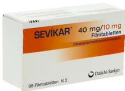
PZN: 09340217 Sevikar 40 mg/10 mg 98 Filmtabletten