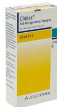
PZN: 04363981 Clobex 500 Mikrogramm/g Shampoo 125 ml