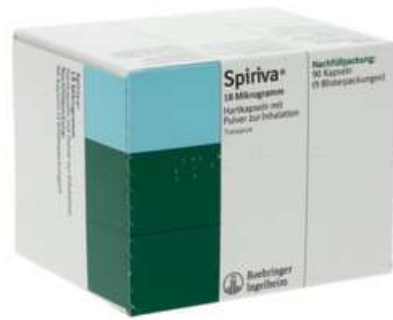
PZN: 10947597 Spiriva 18 mcg 90 Hartkapseln