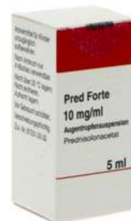
PZN: 05030678 Pred forte 10 mg / ml Augentropfensuspension 5 ml