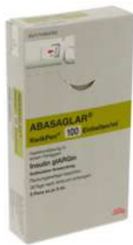
PZN: 18219236 Abasaglar 100 Einheiten/ml KwikPen 5 Fertigpens*