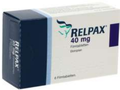
PZN: 13332376 Relpax 40mg 6 Filmtabletten