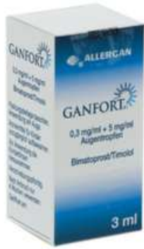
PZN: 00793360 Ganfort 0,3mg/ml+5mg/ml Augentropfen