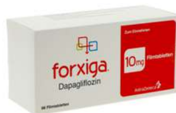
PZN: 18053557 Forxiga 10 mg 98 Filmtabletten