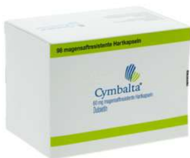
PZN: 00403531 Cymbalta 60 mg 98 Hartkapseln