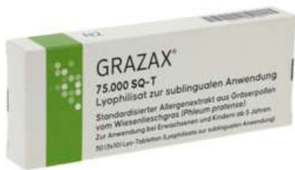
PZN: 16937588 Grazax 75000 SQ-T 30 Lyo- Tabletten