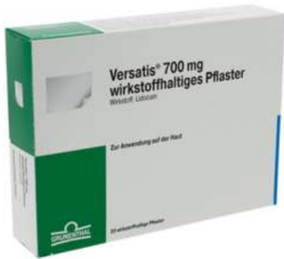
PZN: 15631580 Versatis 700mg 20 wirkstoffhaltiges Pflaster