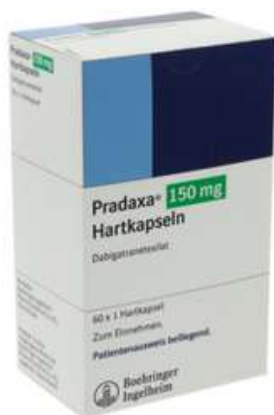
PZN: 17505299 Pradaxa 150 mg 60 Hartkapseln