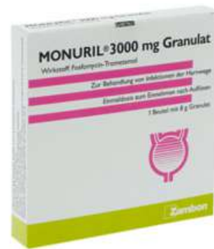
PZN: 11287447 Monuril 3000mg Granulat 1x8g