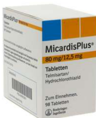
PZN: 06063361 Micardis plus 80 mg/12.5 mg 98 Tabletten