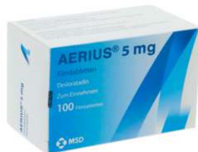
PZN: 05124534 Aeries 5 mg 100 Filmtabletten