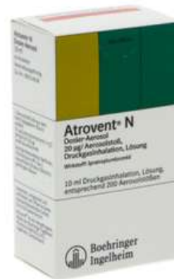
PZN: 11512915 Atrovent N Dosier-Aerosol 10 ml