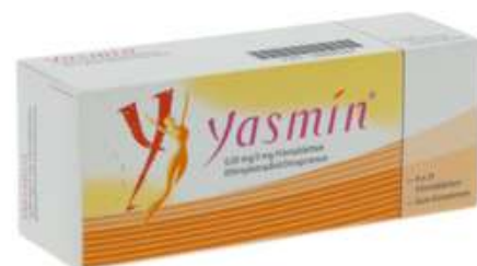
PZN: 08880087 Yasmin 0,03mg/3mg 6x21 Filmtabletten