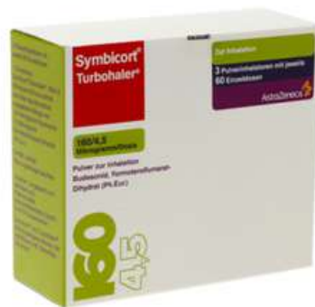
PZN: 03652878 Symbicort Turbhaler 160/4.5 mcg 60x3 Dosis