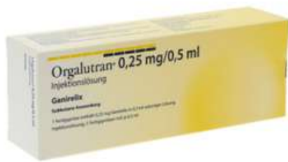
PZN: 18224680 Orgalutran 0,25 mg/0,5 ml Injektionslösung 5x1 FSP