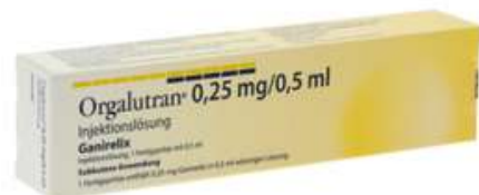
PZN: 18224674 Orgalutran 0,25 mg/0,5 ml Injektionslösung 1x1 Fertigspritze