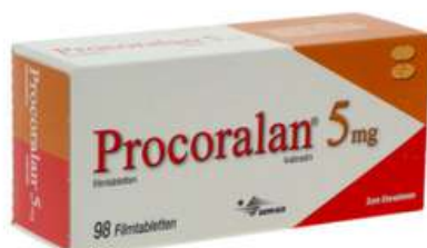
PZN: 10554515 Procoralan 5mg Filmtabletten