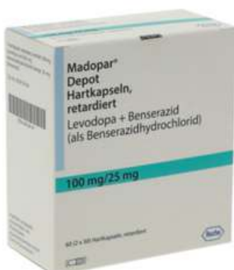
PZN: 09194141 Madopar Depot 60 Hartkapseln retardiert