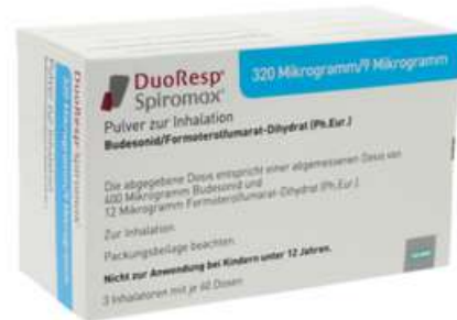
PZN: 11174720 Duoresp Spiromax 320µg/9µg/Dosis 3x60 ED Inhalationspulver