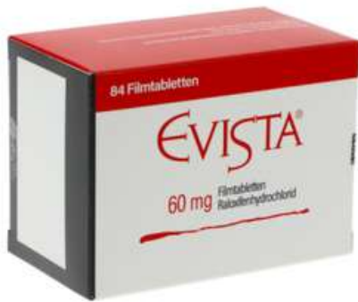
PZN: 00003412 Evista 60 mg 84 Filmtabletten