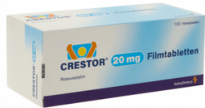
PZN: 06429129 Crestor 20mg 100 Filmtabletten