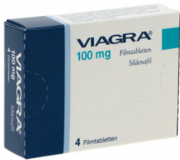
PZN: 05556110 Viagra 100 mg 4 Filmtabletten