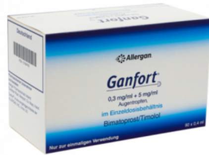
PZN: 13164743 Ganfort 0.3 mg/ml+5mg/ml 90x0.4ml Augentropfen