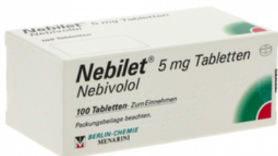
PZN: 13595816 Nebilet 5mg 100 Tabletten