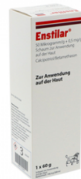
PZN: 17312672 Enstilar 50 Mikrogramm/g + 0,5mg/g Schaum 1x60 g