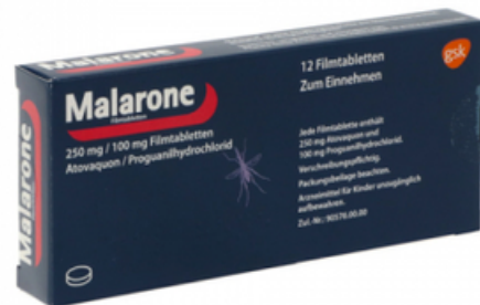
PZN: 10707367 Malarone 250mg/100mg 12 Filmtabletten