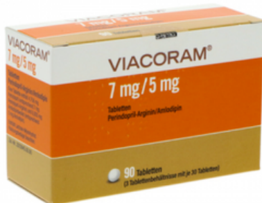
PZN: 17627536 Viacoram 7mg/5mg 90 Tabletten