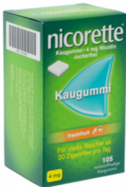
PZN: 07274835 Nicorette Freshfruit 4 mg 105 Kaugummi