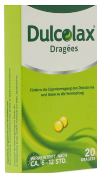
PZN: 07261123 DULCOLAX 5 mg magensaftresistente 20 Tabletten