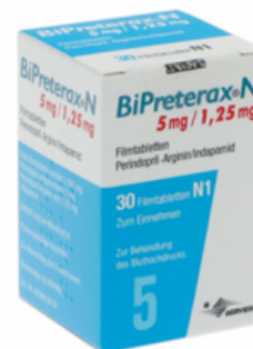
PZN: 06347957 BiPreterax 5 mg/1.25 mg 30 Filmtabletten