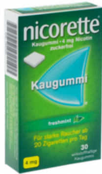
PZN: 10041945 Nicorette Freshmint 4 mg 30 Kaugummi