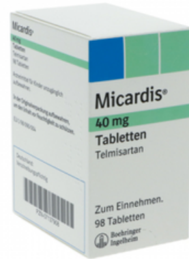
PZN: 07137908 Micardis 40mg 98 Tabletten