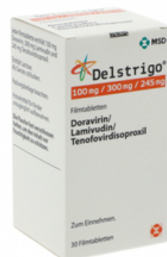
PZN: 18066198 Delstrigo 100 mg/300 mg/245 mg 1x30 Filmtabletten