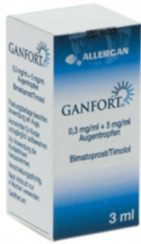
PZN: 00793360 Ganfort 0,3mg/ml+5mg/ml Augentropfen