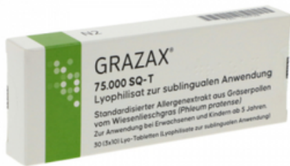
PZN: 16937588 Grazax 75000 SQ-T 30 Lyo- Tabletten