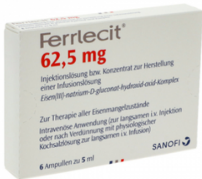
PZN: 10012122 Ferrlecit 62,5mg Ampullen 5ml