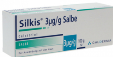
PZN: 06617078 Silkis 3 mcg/g Salbe 100 g