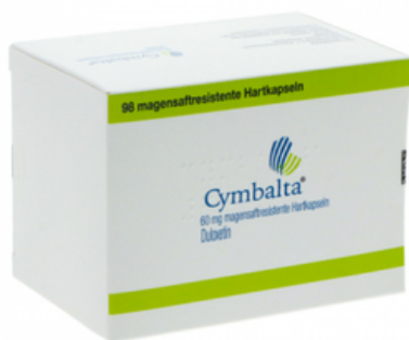
PZN: 00403531 Cymbalta 60 mg 98 Hartkapseln