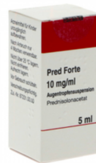
PZN: 05030678 Pred forte 10 mg / ml Augentropfensuspension 5 ml