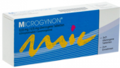
PZN: 04447086 Microgynon 0,03 mg/0,15 mg 3x21 überzogene Tabletten