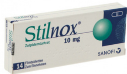
PZN: 18451654 Stilnox 10 mg 14 Filmtabletten