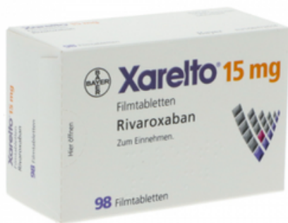
PZN: 10012168 Xarelto 15mg 98 Filmtabletten