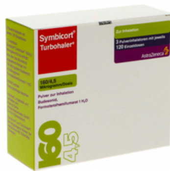
PZN: 03652312 Symbicort Turbhaler 160/4.5 mcg 120x3 Dosis