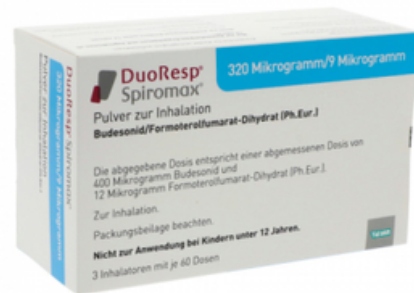
PZN: 11174720 Duoresp Spiromax 320µg/9µg/Dosis 3x60 ED Inhalationspulver