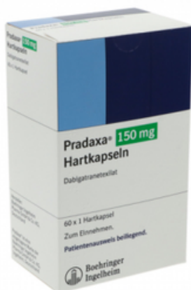
PZN: 17505299 Pradaxa 150 mg 60 Hartkapseln