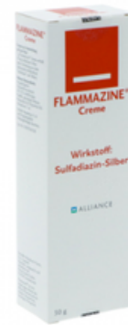
PZN: 10206085 Flammazine Creme 50g