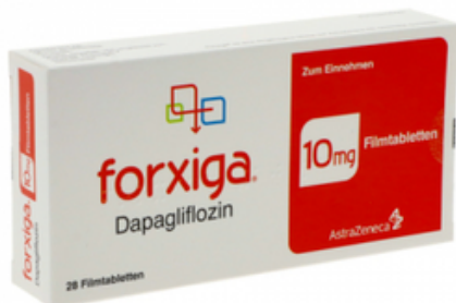
PZN: 18053540 Forxiga 10 mg 28 Filmtabletten