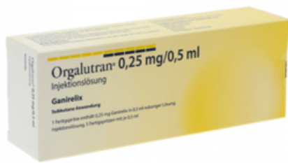
PZN: 18224680 Orgalutran 0,25 mg/0,5 ml Injektionslösung 5x1 FSP