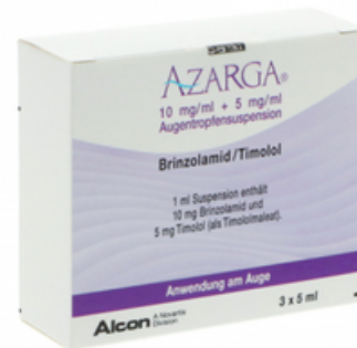
PZN: 11079246 Azarga 10 mg/ml + 5 mg/ml Augentropfsuspension 3x5 ml