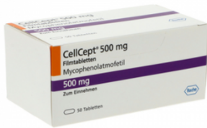
PZN: 10792901 CellCept 500 mg 50 Filmtabletten