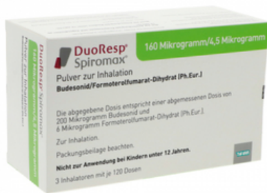
PZN: 11174683 Duoresp Spiromax 160µg/4,5µg/Dosis 3x120 ED Inhalationspulver