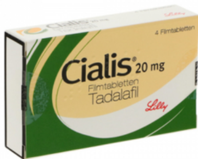
PZN: 00043423 Cialis 20 mg 4 Filmtabletten