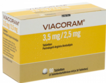
PZN: 17627507 Viacoram 3.5mg/2.5mg 90 Tabletten