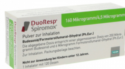
PZN: 11174654 Duoresp Spiromax 160 \mu\text{g}/4,5\mu\text{g}/\text{Dosis} 1 x 120 ED Inhalationspulver