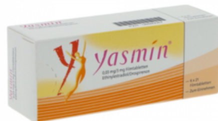
PZN: 08880087 Yasmin 0,03mg/3mg 6x21 Filmtabletten