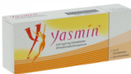
PZN: 08880070 Yasmin 0,03mg/3mg 3x21 Filmtabletten