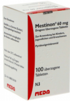
PZN: 10058650 Mestion 60 mg 100 überzogene Tabletten