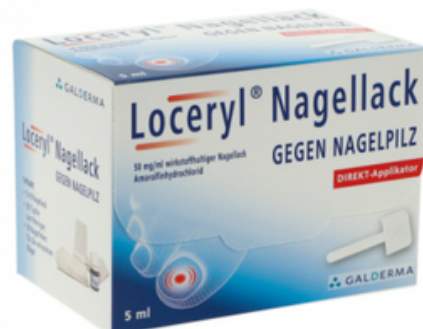
PZN: 18063857 Loceryl Nagellack 5 ml