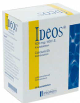
PZN: 12539299 Ideos 500 mg / 400 I.E. 90 Kautabletten