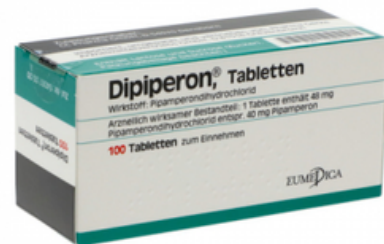
PZN: 13248121 Dipiperon 100 Tabletten