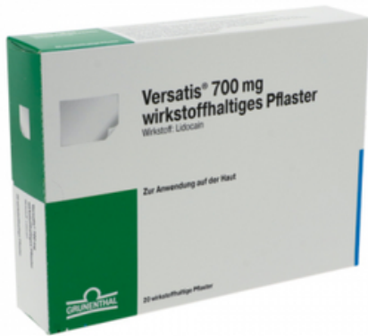
PZN: 15631580 Versatis 700mg 20 wirkstoffhaltiges Pflaster