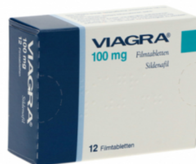
PZN: 04169931 Viagra 100 mg 12 Filmtabletten