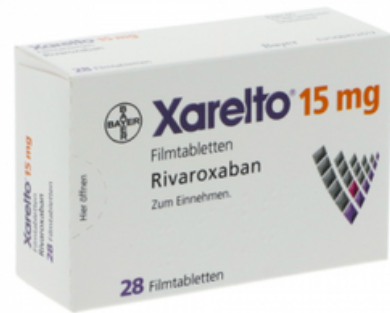
PZN: 10012145 Xarelto 15mg 28 Filmtabletten