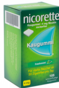
PZN: 10041968 Nicorette Freshmint 4 mg 105 Kaugummi