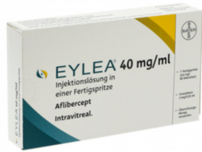
PZN: 17438887 Eylea 40mg/ml Injektionslösung i.e.Fertigspritze x 1*