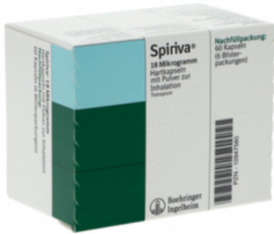
PZN: 10947580 Spiriva 18 mcg 60 Hartkapseln