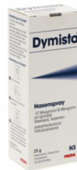
PZN: 18004286 Dymista Nasenspray 137 mcg/50 mcg/Sprühstoß