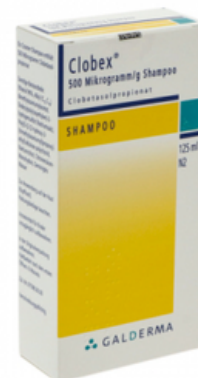
PZN: 04363981 Clobex 500 Mikrogramm/g Shampoo 125 ml