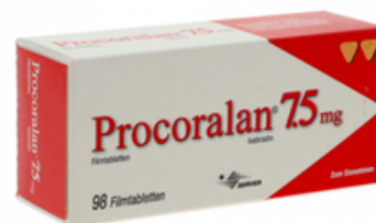
PZN: 10554538 Procoralan 7,5mg 98 Filmtabletten