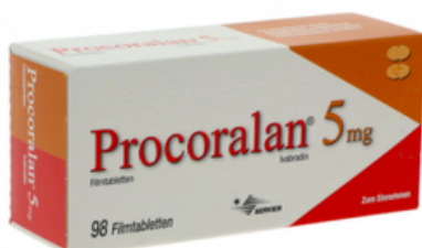
PZN: 10554515 Procoralan 5mg Filmtabletten