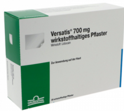
PZN: 15631597 Versatis 700mg 30 wirkstoffhaltige Pflaster