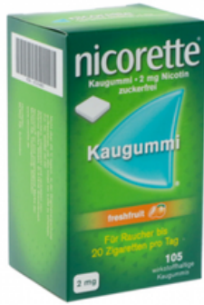
PZN: 07274663 Nicorette Freshfruit 2 mg 105 Kaugummi