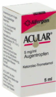
PZN: 01456191 Acular 5 mg/ml Augentropfen 5 ml