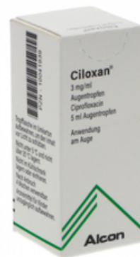
PZN: 10041939 Ciloxan Augentropfen 5 ml