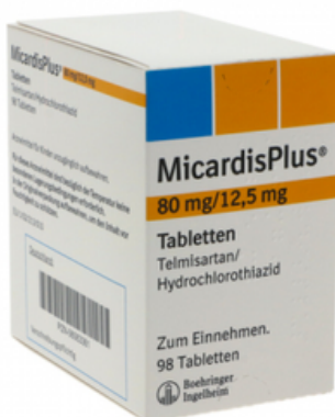
PZN: 06063361 Micardis plus 80 mg/12.5 mg 98 Tabletten