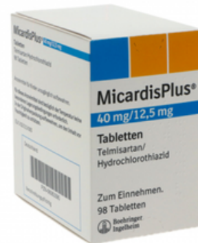
PZN: 06063390 Micardis plus 40 mg/12.5 mg 98 Tabletten