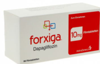
PZN: 18053557 Forxiga 10 mg 98 Filmtabletten