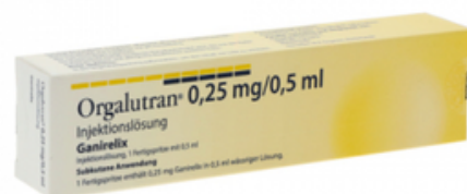
PZN: 18224674 Orgalutran 0,25 mg/0,5 ml Injektionslösung 1x1 Fertigspritze