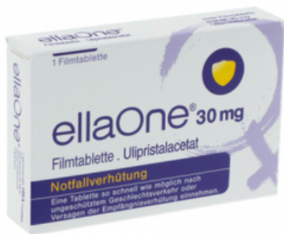
PZN: 15570571 Ellaone 30 mg Filmtablette