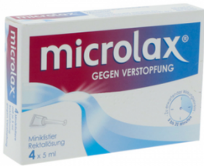
PZN: 13248606 MICROLAX 4x5 ml Rektallösung Klistier