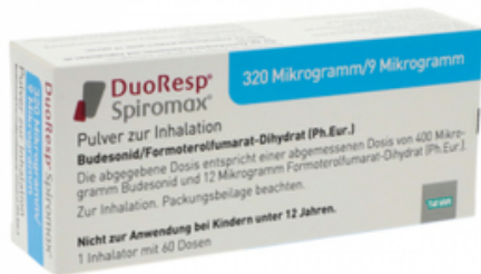
PZN: 11174708 Duoresp Spiromax 320µg/9µg/Dosis 60 ED Inhalationspulver