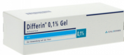
PZN: 17526769 Differin 0.1% Gel 2x30g