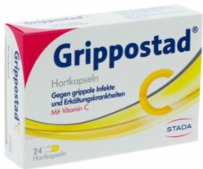
PZN: 07100897 Grippostad C 24 Hartkapseln