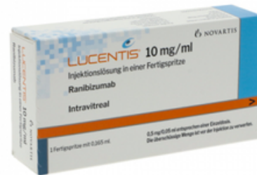
PZN: 12802897 Lucentis 10mg/ml 1 Injektionslösung*