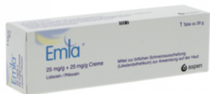
PZN: 13983004 Emla Creme 30 g