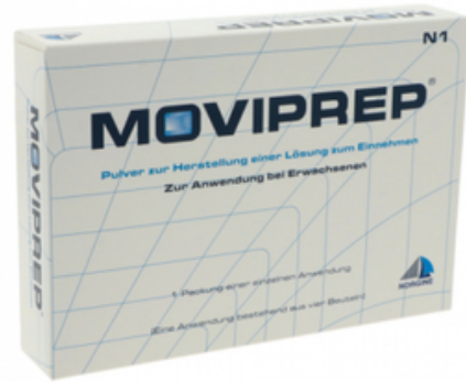
PZN: 13248575 MICROLAX 50x5 ml Rektallösung Klistier