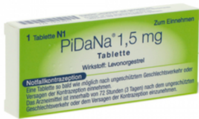
PZN: 19342051 PiDaNa 1,5 mg 1 Tbl.