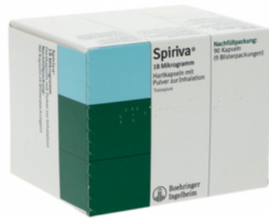
PZN: 10947597 Spiriva 18 mcg 90 Hartkapseln