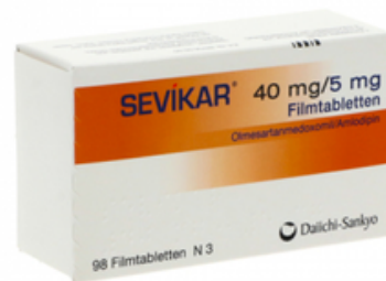
PZN: 09338930 Sevikar 40mg/5mg 98 Filmtabletten