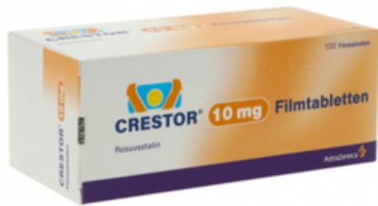
PZN: 06429081 Crestor 10mg 100 Filmtabletten