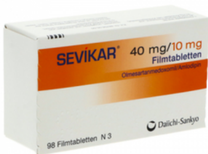
PZN: 09340217 Sevikar 40 mg/10 mg 98 Filmtabletten