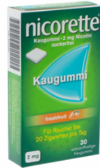
PZN: 07273959 Nicorette Freshfruit 2 mg 30 Kaugummi