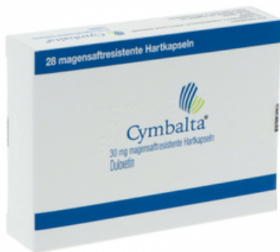
PZN: 07023990 Cymbalta 30 mg 28 Hartkapseln