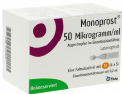
PZN: 14318668 Monoprost 50 mcg/ml Augentropfen ED 30x0,2 ml