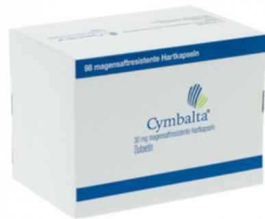
PZN: 01138829 Cymbalta 30 mg 98 Hartkapseln