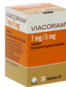
PZN: 17627513 Viacoram 7mg/5mg 30 Tabletten