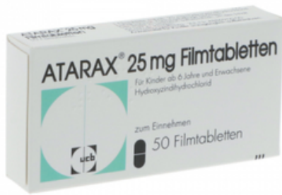
PZN: 01409004 Atarax 25 mg 50 Filmtabletten