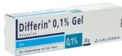
PZN: 17526752 Differin 0.1% Gel 1x30g