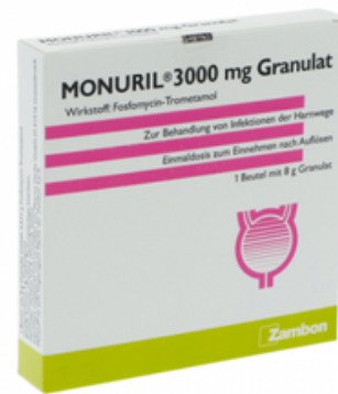
PZN: 11287447 Monuril 3000mg Granulat 1x8g