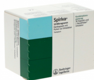
PZN: 10947568 Spiriva 18 mcg 30 Hartkapseln + 1 Handihaler