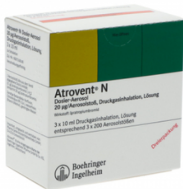
PZN: 11512921 Atrovent N Dosier-Aerosol 3x10 ml