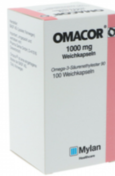
PZN: 09714942 Omacor 1000 mg 100 Weichkapseln