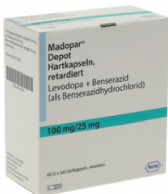
PZN: 09194141 Madopar Depot 60 Hartkapseln retardiert