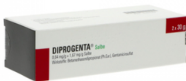
PZN: 03065589 Diprogenta Salbe 2x30 g