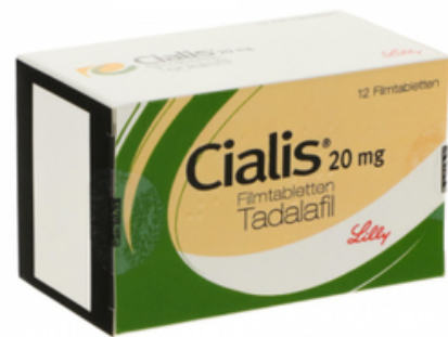
PZN: 00043417 Cialis 20 mg 12 Filmtabletten