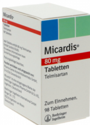
PZN: 07137860 Micardis 80mg 98 Tabletten