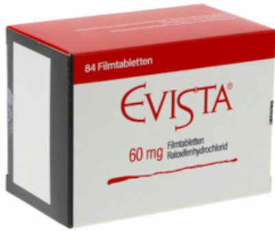
PZN: 00003412 Evista 60 mg 84 Filmtabletten