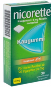
PZN: 07274829 Nicorette Freshfruit 4 mg 30 Kaugummi