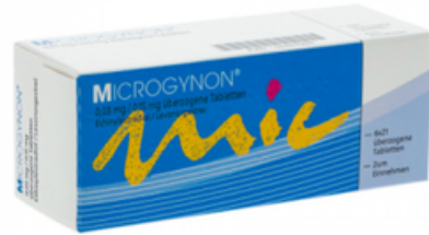
PZN: 04447092 Microgynon 0,03 mg/0,15 mg 6x21 überzogene Tabletten