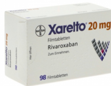
PZN: 10012197 Xarelto 20mg 98 Filmtabletten