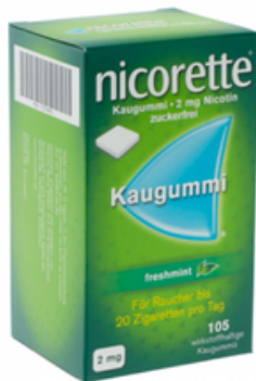
PZN: 07274812 Nicorette Freshmint 2 mg 105 Kaugummi