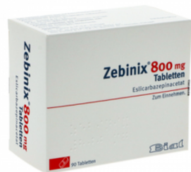
PZN: 10299589 Zebinix 800mg 90 Tabletten