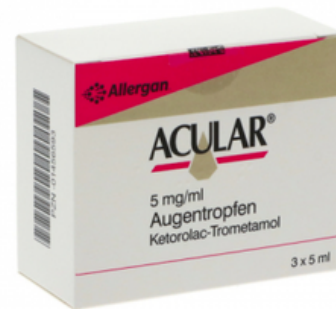
PZN: 01456593 Acular 5 mg/ml Augentropfen 3x5 ml