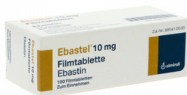
PZN: 15255645 Ebastel 10 mg 100 Filmtabletten