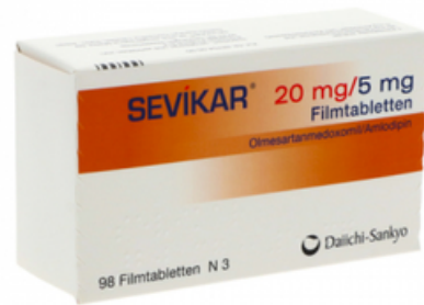
PZN: 11322959 Sevikar 20mg/5mg 98 Filmtabletten