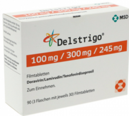
PZN: 18066206 Delstrigo 100 mg/300 mg/245 mg 3x30 Filmtabletten