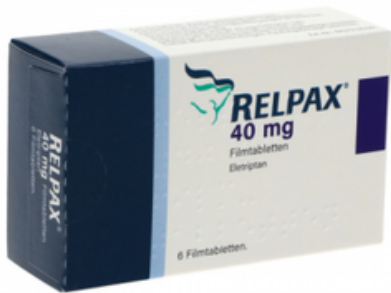
PZN: 13332376 Relpax 40mg 6 Filmtabletten