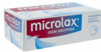
PZN: 13248575 MICROLAX 50x5 ml Rektallösung Klistier