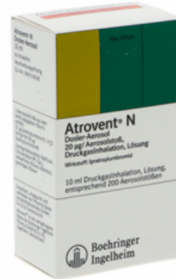
PZN: 11512915 Atrovent N Dosier-Aerosol 10 ml