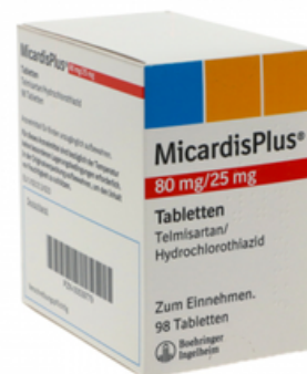
PZN: 00539779 Micardis plus 80 mg/25 mg 98 Tabletten