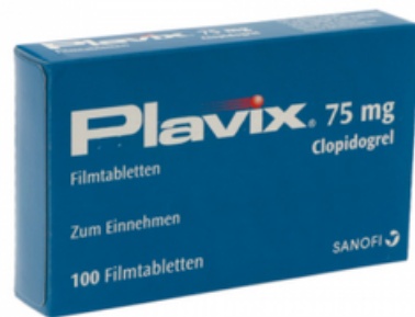
PZN: 04412544 Plavix 75 mg 100 Filmtabletten