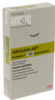
PZN: 18219236 Abasaglar 100 Einheiten/ml KwikPen 5 Fertigungs*