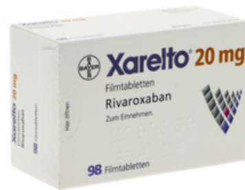
PZN: 10012197 Xarelto 20mg 98 Filmtabletten