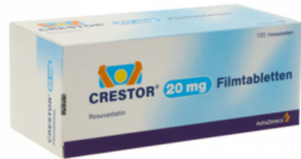
PZN: 06429129 Crestor 20mg 100 Filmtabletten