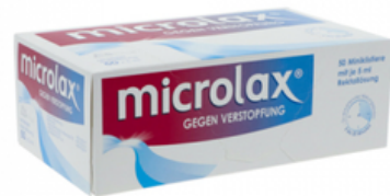
PZN: 13248575 MICROLAX 50x5 ml Rektallösung Klistier