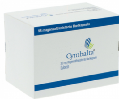
PZN: 01138829 Cymbalta 30 mg 98 Hartkapseln