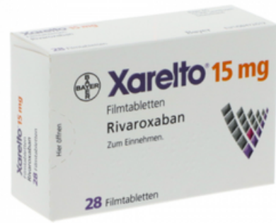
PZN: 10012145 Xarelto 15mg 28 Filmtabletten