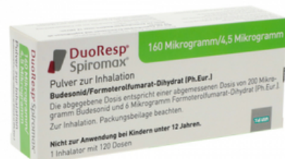
PZN: 11174654 Duoresp Spiromax 160 \mu\text{g}/4,5\mu\text{g}/\text{Dosis} 1 x 120 ED Inhalationspulver