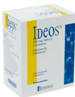
PZN: 12539299 Ideos 500 mg / 400 I.E. 90 Kautabletten