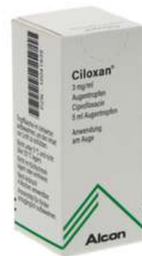
PZN: 10041939 Ciloxan Augentropfen 5 ml