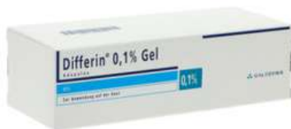
PZN: 17526769 Differin 0.1% Gel 2x30g