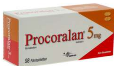
PZN: 10554515 Procoralan 5mg Filmtabletten