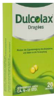
PZN: 07261123 DULCOLAX 5 mg magensaftresistente 20 Tabletten