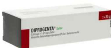
PZN: 03065589 Diprogenta Salbe 2x30 g