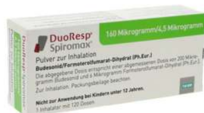
PZN: 11174654 Duoresp Spiromax 160 µg/4,5µg/Dosis 1 x 120 ED Inhalationspulver