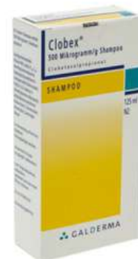
PZN: 04363981 Clobex 500 Mikrogramm/g Shampoo 125 ml