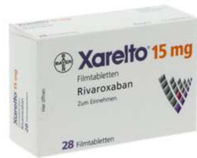
PZN: 10012145 Xarelto 15mg 28 Filmtabletten