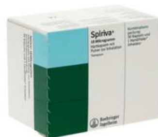
PZN: 10947568 Spiriva 18 mcg 30 Hartkapseln + 1 Handhaler