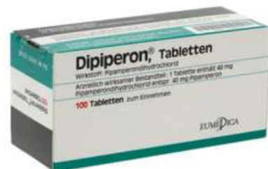
PZN: 13248121 Dipiperon 100 Tabletten