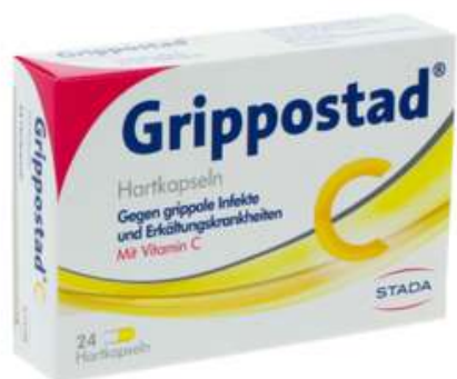
PZN: 07100897 Grippostad C 24 Hartkapseln