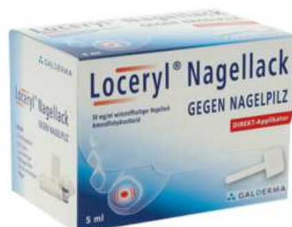
PZN: 18063857 Loceryl Nagellack 5 ml