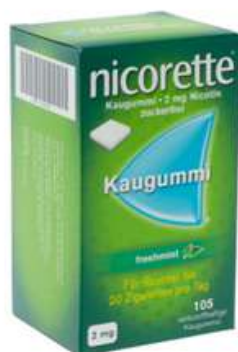
PZN: 07274812 Nicorette Freshmint 2 mg 105 Kaugummi