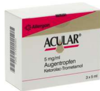
PZN: 01456593 Acular 5 mg/ml Augentropfen 3x5 ml