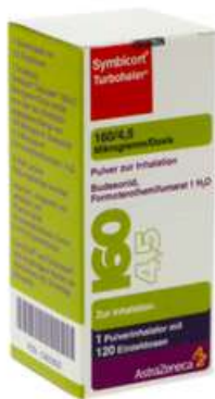
PZN: 03652625 Symbicort Turbhaler 160/4.5 mcg 120x1 Dosis