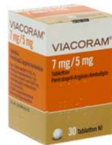
PZN: 17627513 Viacoram 7mg/5mg 30 Tabletten