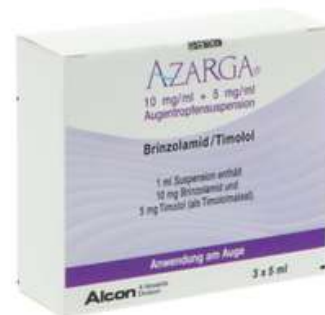
PZN: 11079246 Azarga 10 mg/ml + 5 mg/ml Augentropfensuspension 3x5 ml