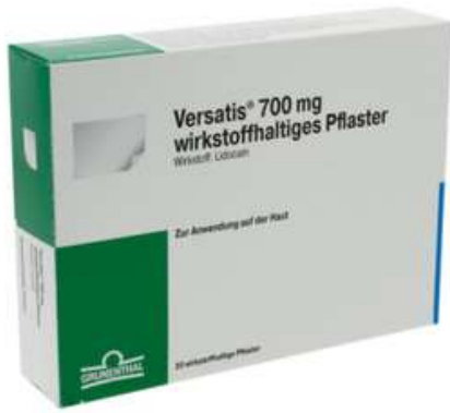
PZN: 15631580 Versatis 700mg 20 wirkstoffhaltiges Pflaster