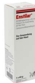
PZN: 17312672 Enstilar 50 Mikrogramm/g + 0,5mg/g Schaum 1x60 g