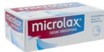
PZN: 13248575 MICROLAX 50x5 ml Rektallösung Klistier