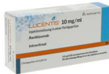
PZN: 12802897 Lucentis 10mg/ml 1 Injektionslösung*