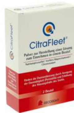
PZN: 19377279 CITRAFLEET Plv.z.Her.e.Lsg.z.Einnehmen Beutel