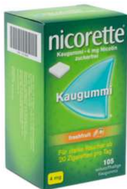
PZN: 07274835 Nicorette Freshfruit 4 mg 105 Kaugummi