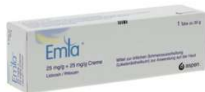
PZN: 13983004 Emla Creme 30 g