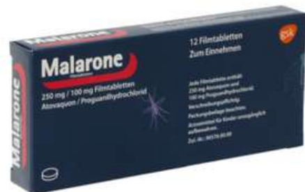
PZN: 10707367 Malarone 250mg/100mg 12 Filmtabletten