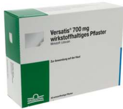
PZN: 15631597 Versatis 700mg 30 wirkstoffhaltige Pflaster