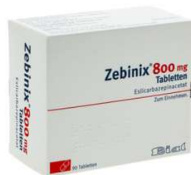
PZN: 10299589 Zebinix 800mg 90 Tabletten