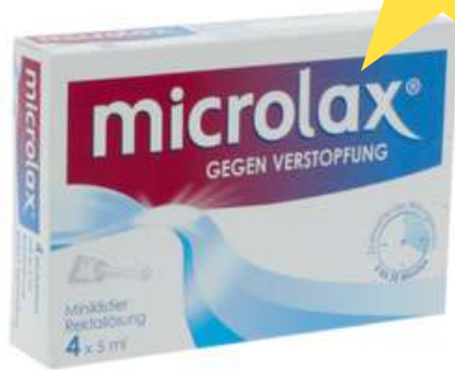
PZN: 13248606 MICROLAX 4x5 ml Rektallösung Klistier