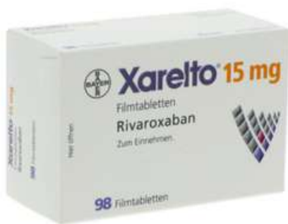
PZN: 10012168 Xarelto 15mg 98 Filmtabletten