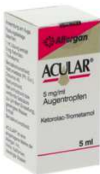
PZN: 01456191 Acular 5 mg/ml Augentropfen 5 ml