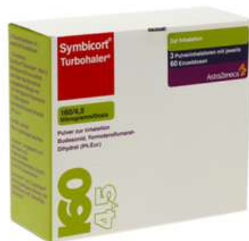
PZN: 03652878 Symbicort Turbhaler 160/4.5 mcg 60x3 Dosis