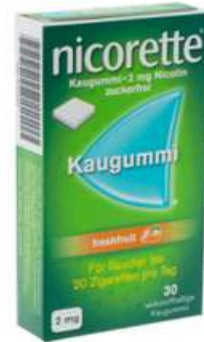
PZN: 07273959 Nicorette Freshfruit 2 mg 30 Kaugummi