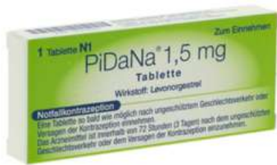
PZN: 19342051 PiDaNa 1,5 mg 1 Tbl.