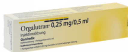
PZN: 18224674 Orgalutran 0,25 mg/0,5 ml Injektionslösung 1x1 Fertigspritze