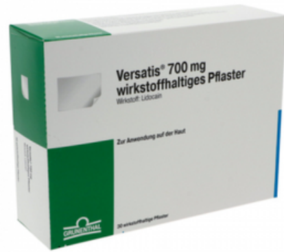
PZN: 15631597 Versatis 700mg 30 wirkstoffhaltige Pflaster