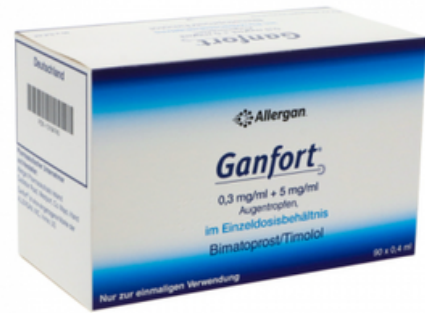
PZN: 13164743 Ganfort 0.3 mg/ml+5mg/ml 90x0.4ml Augentropfen