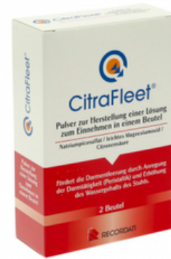
PZN: 19377279 CITRAFLEET Plv.z.Her.e.Lsg.z.Einnehmen Beutel