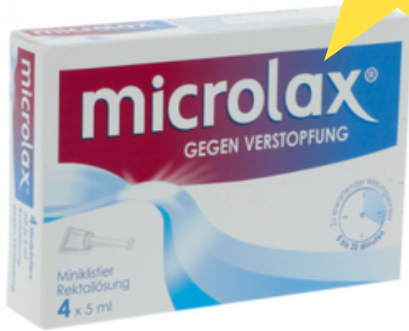
PZN: 13248606 MICROLAX 4x5 ml Rektallösung Klistier