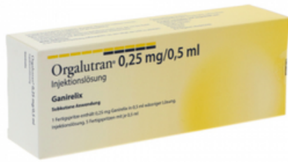
PZN: 18224680 Orgalutran 0,25 mg/0,5 ml Injektionslösung 5x1 FSP