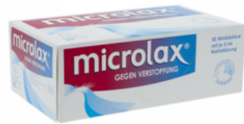
PZN: 13248575 MICROLAX 50x5 ml Rektallösung Klistier