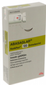
PZN: 18219236 Abasaglar 100 Einheiten/ml KwikPen 5 Fertigungs*