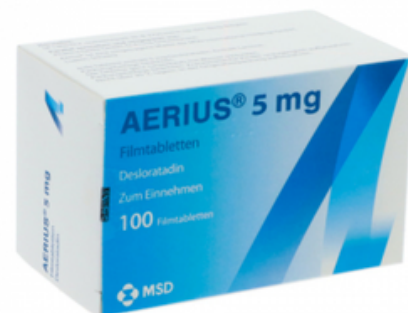
PZN: 05124534 Aerius 5 mg 100 Filmtabletten