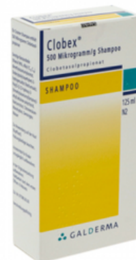
PZN: 04363981 Clobex 500 Mikrogramm/g Shampoo 125 ml