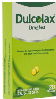
PZN: 07261123 DULCOLAX 5 mg magensaftresistente 20 Tabletten