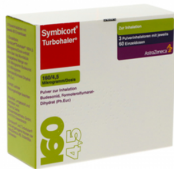
PZN: 03652878 Symbicort Turbohaler 160/4.5 mcg 60x3 Dosis