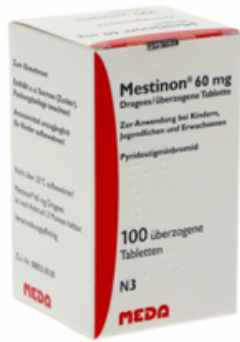
PZN: 10058650 Mestion 60 mg 100 überzogene Tabletten