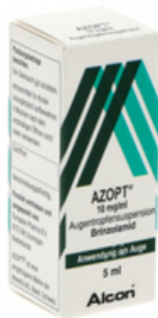
PZN: 11079246 Azopt 10 mg / ml Augentropfen 1x5 ml