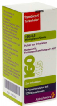
PZN: 03652625 Symbicort Turbohaler 160/4.5 mcg 120x1 Dosis