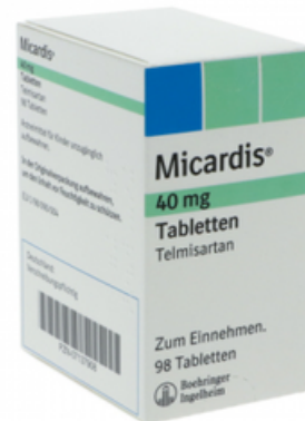
PZN: 07137908 Micardis 40mg 98 Tabletten