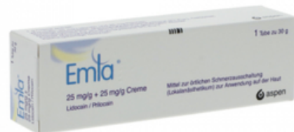
PZN: 13983004 Emla Creme 30 g