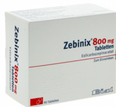
PZN: 10299589 Zebinix 800mg 90 Tabletten